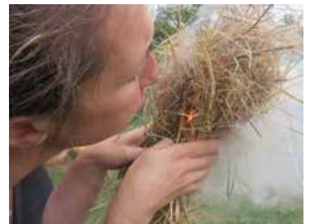
Parc du Thot Démonstration allumage du feu