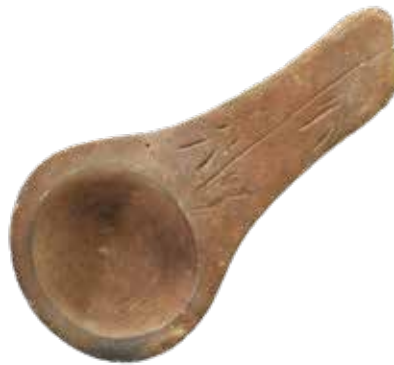
Lampe à graisse

Associer les objets préhistoriques aux objets modernes :